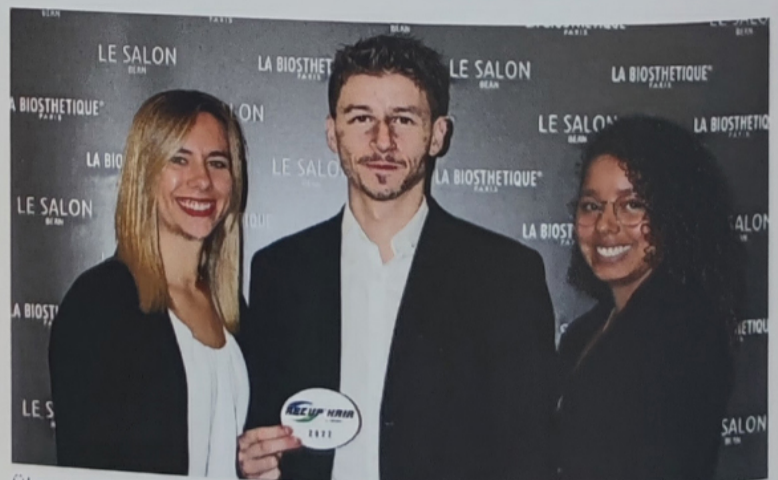
Über 600 Salons haben bereits das RECUP'HAIR Label erhalten